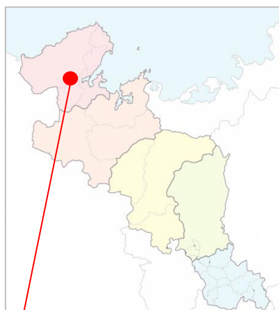
京丹後市大宮町三重・森本地区